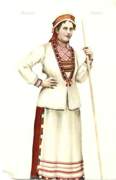
Девушка в традиционном костюме прихода Койвисто. Нач. XX в. Выборгский объединенный музей-заповедник

Первые сведения об обитателях Бьёрке можно подчеркнуть из налоговой переписи населения 1540 г.: около 100 домов, из них 50 на островах и 50 на побережье, общая численность достигала 2000 человек. Первая католическая церковь была расположена на острове Соукансаари, последую-