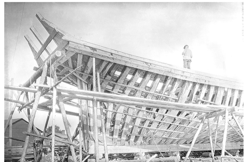
Шхуна на стапеле. 1914 г.

Порт стал центром, вокруг которого сосредоточилось развитие поселка Койвисто. Огромный объем экспорта леса и пиломатериалов из ладожской Карелии и со всего Карельского перешейка, а также импорт каменного угля и товаров различных промышленных предприятий обслуживался местным портом. Соответственно этому поселок Койвисто развивался чрезвычайно динамично. В 1930-е гг. здесь работали железнодорожный и автобусный вокзалы, телеграфная станция, почта, таможня, полиция, лоцманская станция, аптека и больница, гимназия, две народные школы, правление