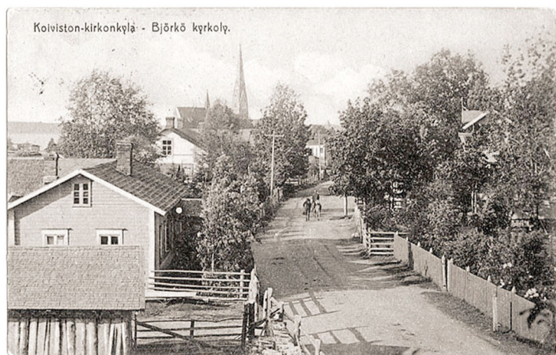
Одна из улиц Бьёрке / Койвисто в нач. XX в.

Историческая справка подготовлена научными сотрудниками Выборгского объединенного музея-заповедника.