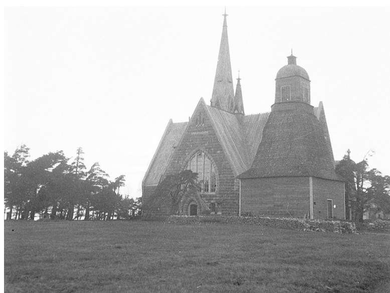
Каменная церковь и старая деревянная колокольня. 1935 г.

Церковная история Бьёрке/Койвисто прослеживается, по крайней мере, с 1575 г. К этому времени Койвисто был самостоятельным приходом. Всего в его истории известно шесть церквей. Первые три строились на островах, в частности, третья церковь, стоявшая на острове Кирккосаари («Церковный», сейчас Большой Берёзовый), которая погибла в 1706 г. во время Северной войны. Четвёртая церковь была построена уже на материке, как и все последующие – на мысе Кирккониemi (ныне мыс Светлый). Она существовала в первой половине XVIII в. В 1763 г. была освящена пятая деревянная крестообразная кирха прихода Бьёрке (Койвисто), а через 12 лет в отдалении от храма была построена колокольня. Завершение строительства и её убранство заняли несколько лет. Эта кирха была осмолена снаружи и окрашена изнутри. Позднее в