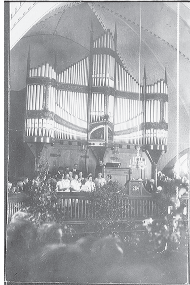
Орган в интерьере церкви. 1930-е гг. Музейное ведомство Финляндии

1 октября 1948 г. Указом Президиума Верховного Совета РСФСР город Койвисто переименовали в город Приморск, а Койвистовский